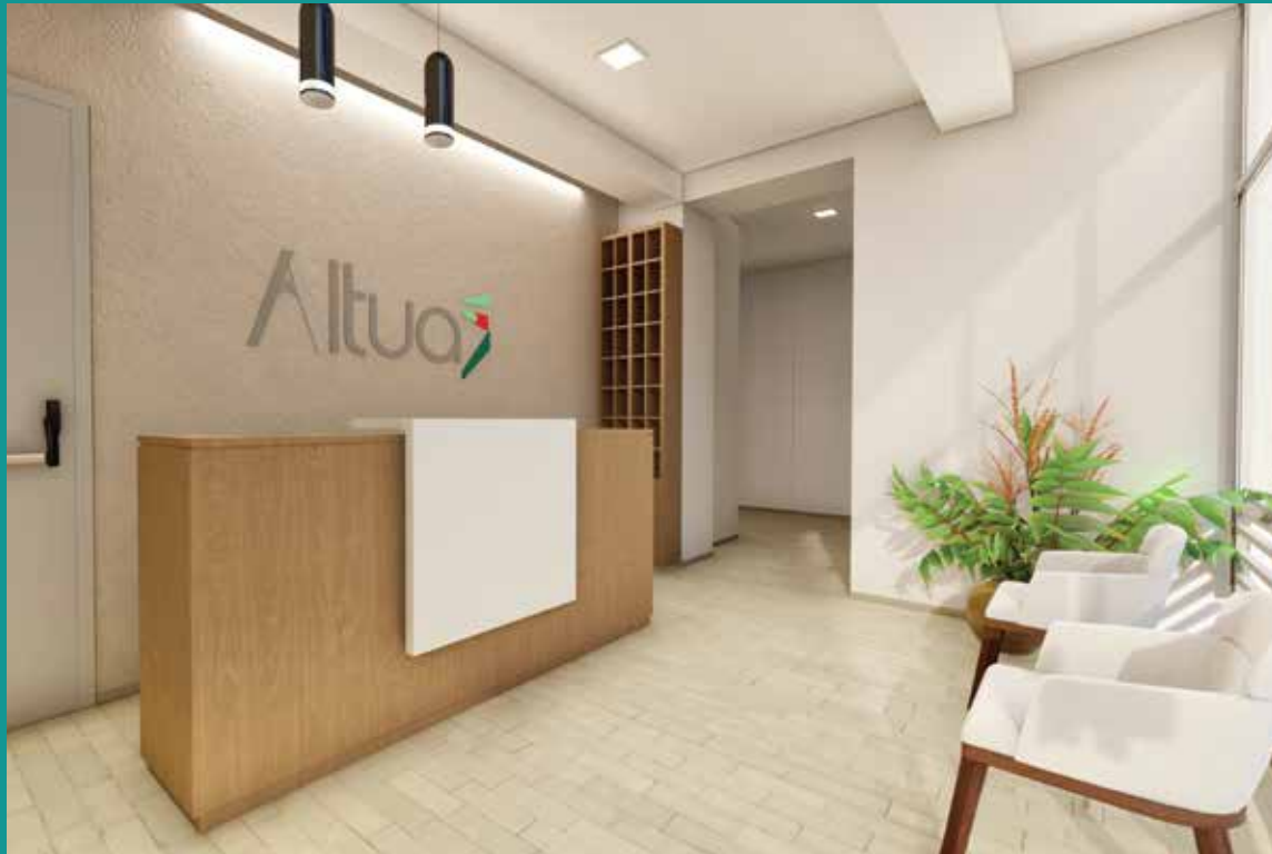
RECEPCIÓN TIPO LOBBY