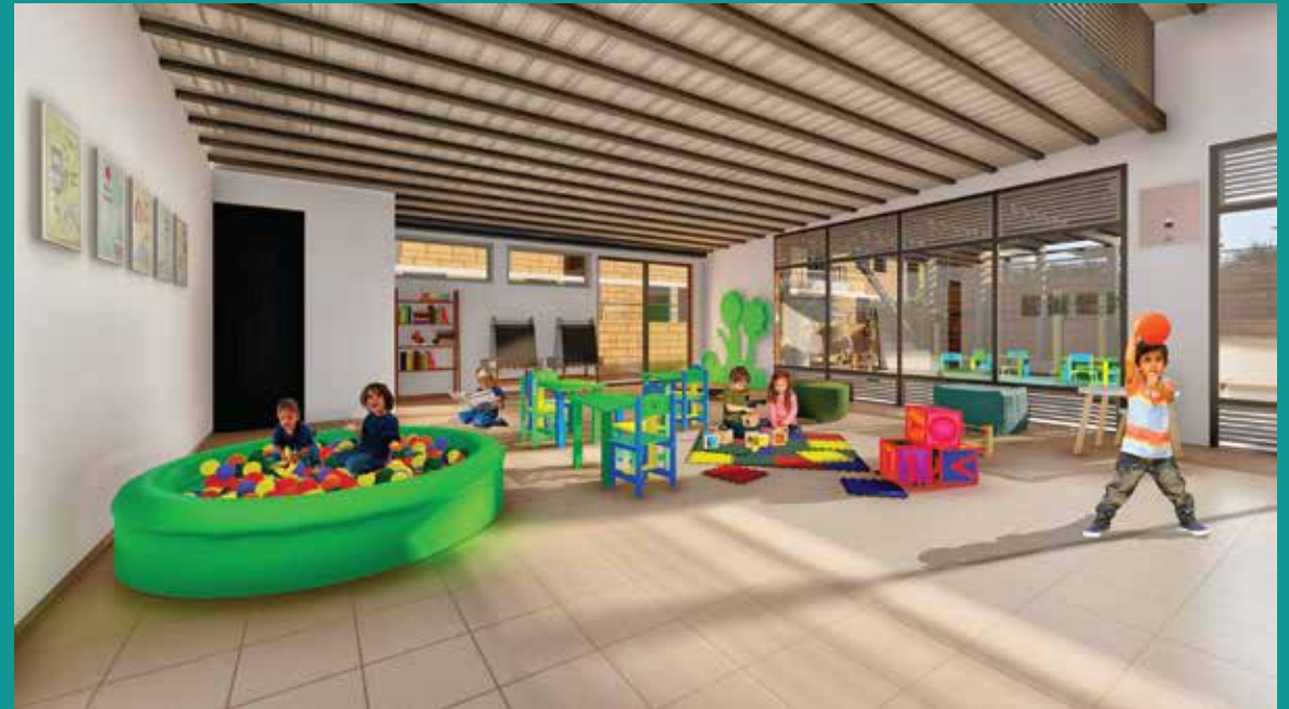
ZONA DE JUEGOS INFANTILES