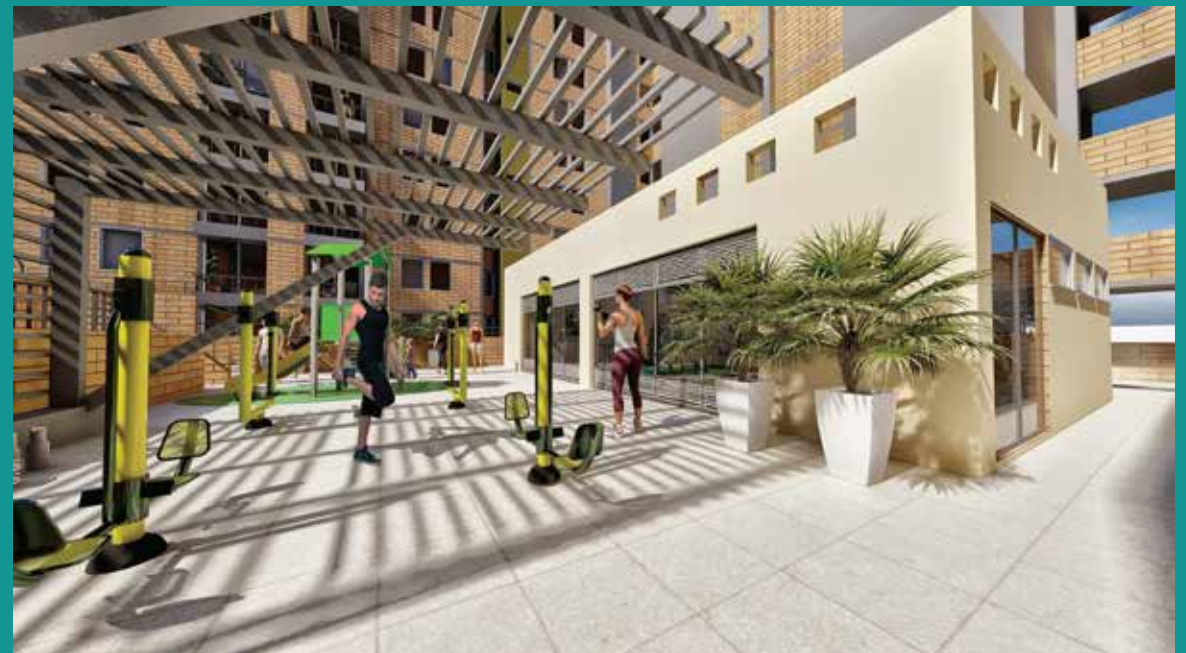
GYM BIOSALUDABLE AL AIRE LIBRE